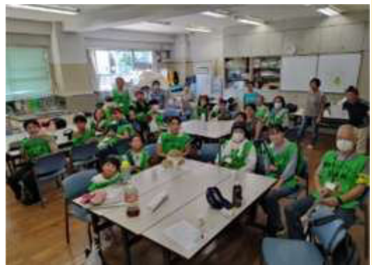
夏ボラの様子です。

問合せ メール「kazu0811kazusann0811@r9.dion.ne.jp」 または 090-4668-6141(松本)までお願いします。