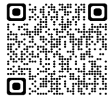
ホームページ QR コード